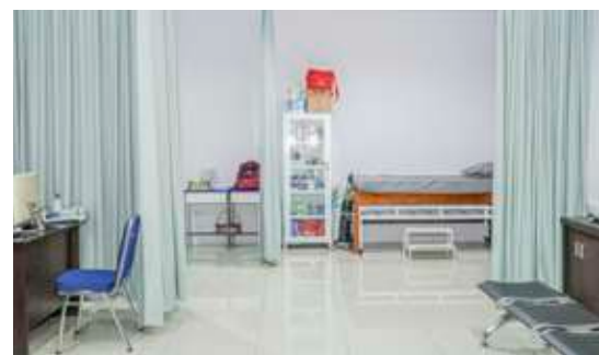
Ruang UKS SIT Insantama Bogor.

Untuk menjadi sekolah sehat sebenarnya tidak mengharuskan adanya sosok seorang dokter karena yang diperlukan adalah program-