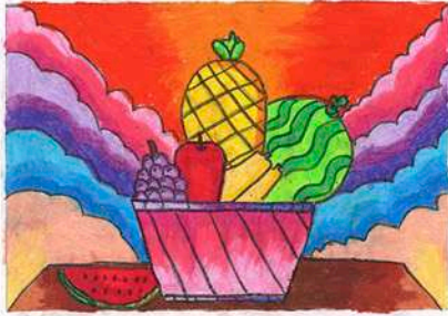
Juara 1 Mewarnai Kelas 1