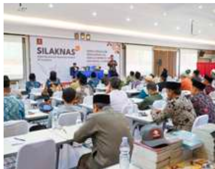
Pelaksanaan Silaknas XIV di Auditorium SIT Insantama Bogor.

Insantama pusat juga membentuk tim dan menyiapkan pelatihan, startup cabang, dan juga memahamkan masalah keinsantamaan beserta dengan konsep-konsepnya. Setahun sekali ada kegiatan silaturahmi kerja nasional (silaknas) sebagai ajang koordinasi tahunan dengan cabang. Biasanya membahas