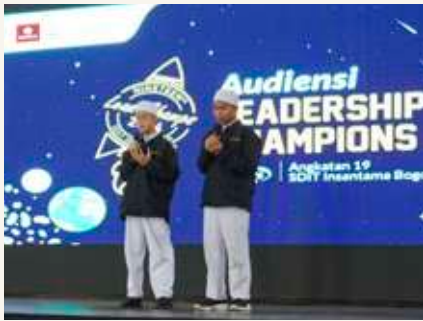
Audiensi delegasi Leadchamps SDIT Insantama Bogor di ITB.

bertemu dengan tiga alumni Insantama di acara temu alumni. Mereka semuanya berkuliah di ITB. Mereka didaulat untuk memberikan motivasi kepada adik-adik almahmaternya agar para peserta LC #3 ini senantiasa bersemangat menyiapkan masa depan mereka.