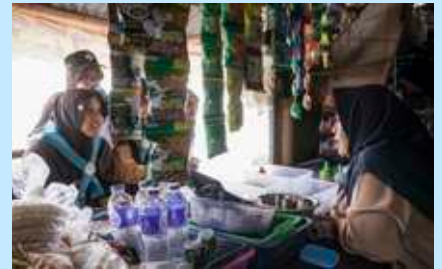
Delegasi LKMM melakukan wawancara kepada masyarakat Desa Naggerang.

Dalam program ini, Algazel menginap di Naggerang selama 4 hari 3 malam untuk menyelami kehidupan warga dan melakukan wawancara mendalam