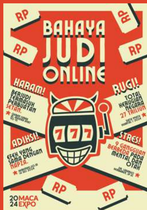
Infografis karya Shafiq, Juara 1 Lomba Infografis Maca Expo VII.

“Mana poin yang menunjukkan keharamannya? Kita ini sebagai Muslim mestilah selalu mengaitkan segala sesuatunya dengan Islam. Sebelum dipublikasikan, tolong antum revisi dengan menambahkan poin bahwa judi itu haram ya,” ujar juri kemudian disambut anggukan Irfan.