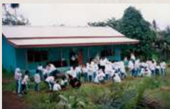
Gedung sekolah di periode awal SIT Insantama Bogor beroperasi.

Tim kemudian berkejaran dengan waktu mencari dana yang dibutuhkan untuk melunasi harga tanah yang telah disepakati. Di situlah pertolongan Allah datang, niat yang baik disambut oleh Allah dengan memberikan pertolongan melalui orang lain. Ada seseorang yang