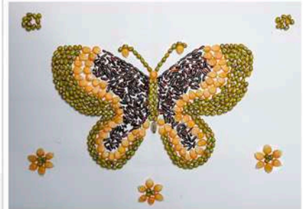
Juara 1 Kolase Kelas 3