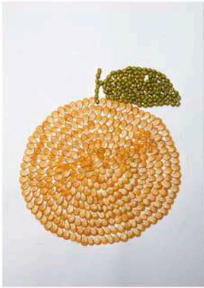
Juara 1 Kolase Kelas 1