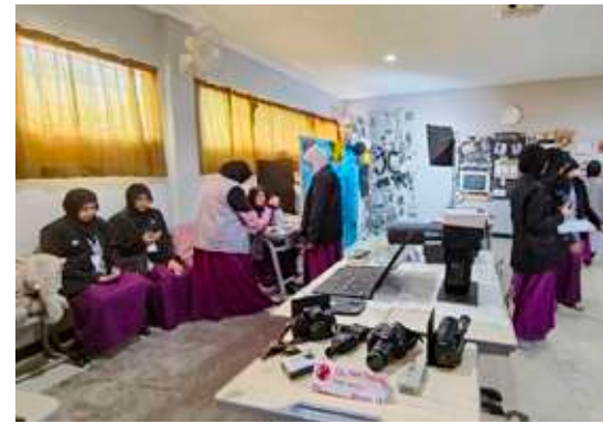
Wahana Edukasi Journalist Club Akhwat.