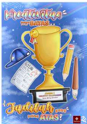
Juara 1 Terbaik Poster Digital