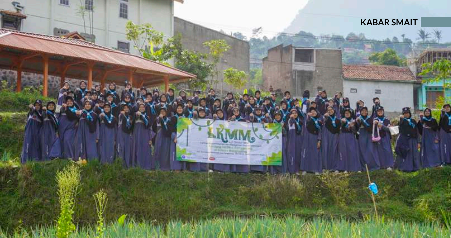
Foto bersama delegasi LKMM Akhwat.

( indepth interview ). Hasil wawancara disusun sedemikian rupa dalam bentuk analisis SWOT hingga memberikan posisi desa berikut rekomendasi strategis dan aksinya untuk membantu desa agar dapat lebih maju dan berkah.