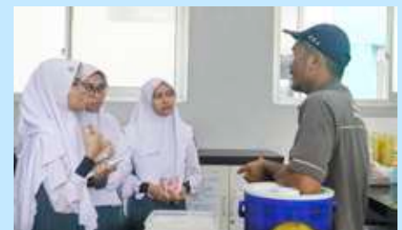
Pendalaman Analisis SWOT di lingkungan sekolah.

mengorbankan sebagian dari tabungan pribadi.