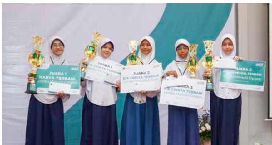
Para juara lomba menulis cerpen, Jambore Nasional Insantama 2024.

Menulis juga mendorong siswa untuk menyelidiki dan memahami sesuatu secara mendalam. Kegiatan menyelidiki ini dapat dilakukan dengan berbagai cara, misalnya membaca, melakukan pengamatan, wawancara, penelitian, dan kegiatan lainnya. Dengan menulis akan memicu siswa untuk menuangkan ide, gagasan yang akan dijelaskan secara runut dan logis agar dapat dipahami pembaca.