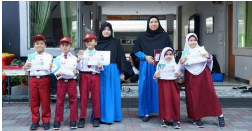
Foto bersama siswa yang meraih silver ticket HKSN untuk melaju ke babak selanjutnya.

Dalam rangka menyambut perayaan 24 Tahun Insantama 2025, Hari Kreativitas Siswa (HKS) SDIT Insantama mengalami transformasi besar. Bagaimana tidak? Untuk pertama kalinya, HKS yang biasanya diselenggarakan di sekolah masing-masing, kali ini akan diselenggarakan secara nasional dengan nama Hari Kreativitas Siswa Nasional (HKSN), mempertemukan 21 cabang SDIT Insantama dari seluruh Indonesia. Acara ini bertujuan untuk menjangkau peserta terbaik dari 21 cabang Insantama.