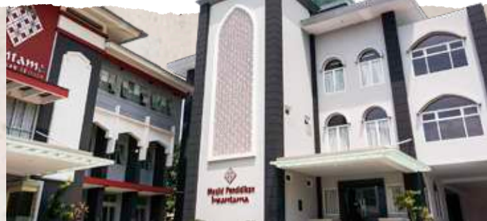
Gedung SIT Insantama Bogor tahun 2024.