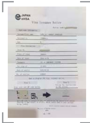
Dokumen pengurusan VISA Jepang.