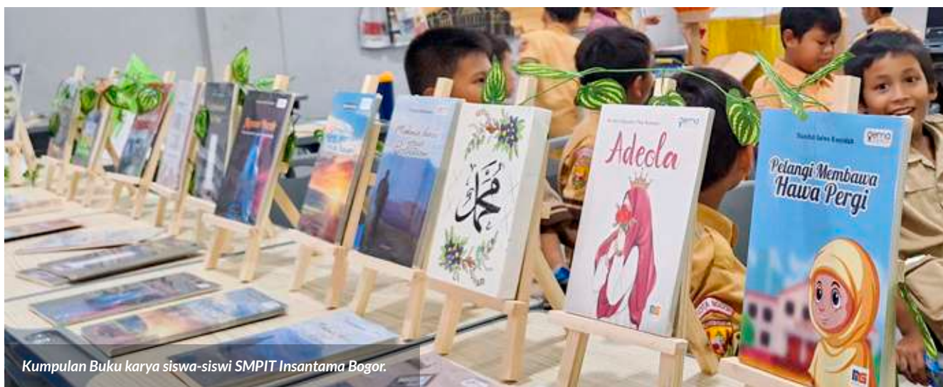
Kumpulan Buku karya siswa-siswi SMPIT Insantama Bogor.

Tradisi menulis terus dilakukan hingga masa kekhalifahan selanjutnya. Para ulama dan intelektual Muslim memberikan kontribusi terhadap kemajuan keilmuan di Barat, misalnya adalah Al-Khawarizmi (Bapak Aljabar), Ibnu Sina (Bapak Kedokteran Modern), Ibnu al-Haytham (Penemu Ilmu Optik,