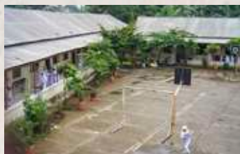
Gedung SIT Insantama Bogor di tempat baru di Hegarmanah, tahun 2008.