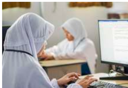
Lomba menulis cerpen Jambore Nasional Insantama 20024.

Al-Biruni (Bapak Geodesi), Al-Kindi (Bapak Filsafat Islam), Al-Farabi (Penemu Not Musik), dan masih banyak lagi.