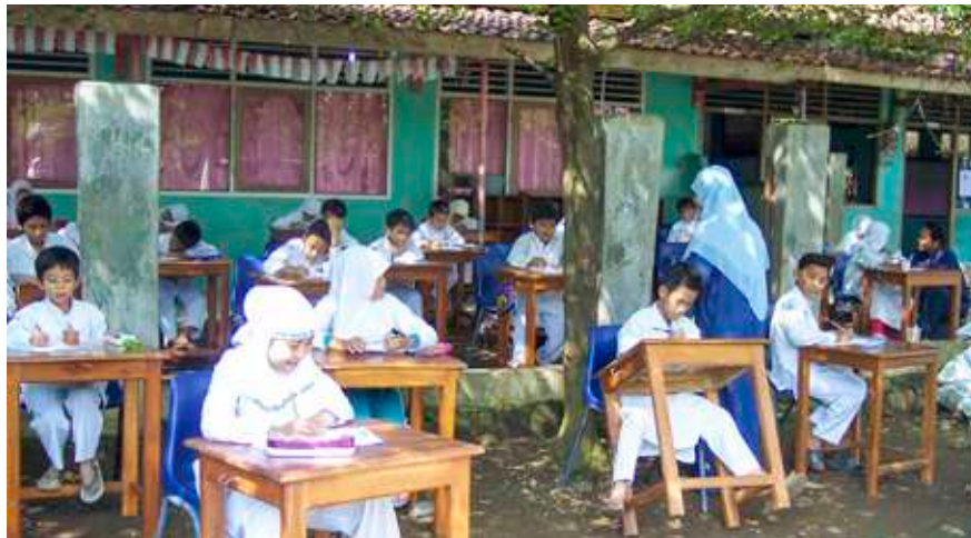
Kegiatan siswa SDIT Insantama di masa awal, saat masih di gedung sewa.