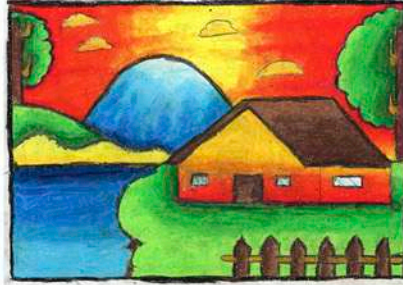
Juara 1 Mewarnai Kelas 2