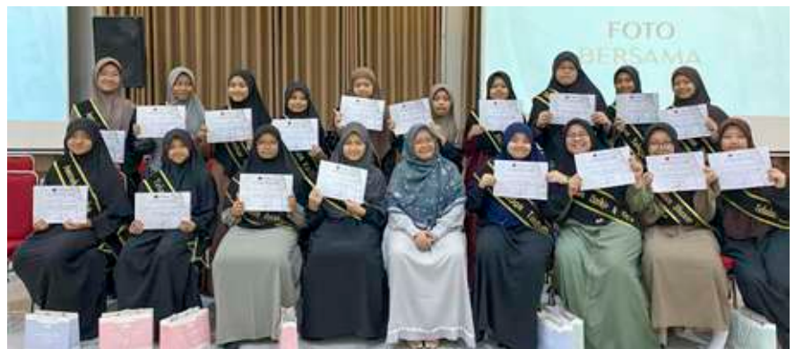
Foto bersama para pemenang nominasi Santri Awards IBS Insantama Bogor.